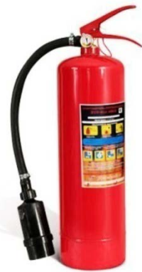
Рис. 6 – воздушно-пенный огнетушитель

Воздушно-пенные огнетушители являются наиболее подходящим вариантом при тушении строений и предметов мебели из дерева, поэтому при выборе огнетушителя для домашнего использования необходимо учитывать, какие материалы преобладают в помещении. Следует учитывать и минусы воздушно-пенных огнетушителей, так как самым главным их недостатком является то, что ими запрещено тушить электрические приборы и технику, а также они замерзают при низких температурах.