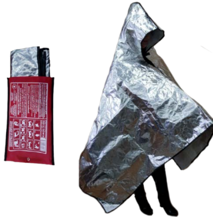
Рис. 8—специальные огнестойкие накидки