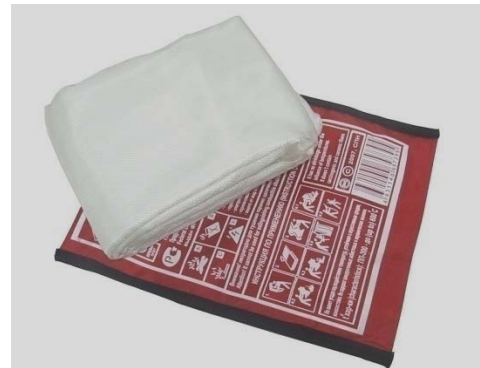
Рис. 3 - кошма

Противопожарное полотно (кошма) предназначена для изоляции очага горения от доступа воздуха. Этот метод очень эффективен, но применяется лишь при небольшом очаге горения. Нельзя использовать для тушения синтетические ткани, которые легко плавятся и разлагаются под воздействием огня, выделяя токсичные газы. Продукты разложения синтетики, как правило, сами являются горючими и способны к внезапной вспышке.