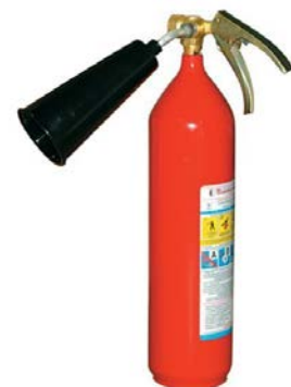
Рис. 4 – углекислотный огнетушитель

Углекислотный огнетушитель является наиболее оптимальным вариантом для жилых помещений, в первую очередь это связано с большим количеством пожарной нагрузки в помещениях, также углекислотный огнетушитель является наиболее эффективным для тушения возгорания бытовой техники или проводки. Одно из явных преимуществ углекислотных огнетушителей – его безопасность для здоровья человека.