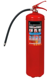
Рис. 5 – порошковый огнетушитель

Огнетушители порошкового типа применяются в основном для тушения ЛВЖ и ГЖ. Принцип действия порошкового огнетушителя основан на выпуске под давлением порошка, который изолирует очаг возгорания, тем самым ликвидируя его. Использование данного типа огнетушителя приводит к образованию токсичного облака, которое в тесном пространстве небезопасно для здоровья человека. Также после оседания облака порошка пострадает и все имущество, находящееся в помещении.