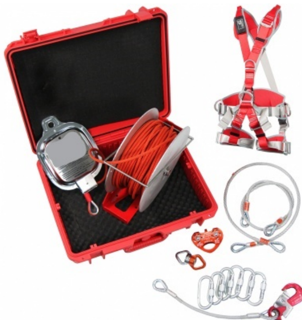
Рис. 9 –канатно-спусковое устройство

Наиболее простыми в использовании являются канатно-спусковые устройства и складные навесные лестницы. Канатно-спусковые устройства делятся на две группы: с автоматическим регулированием скорости спуска, для использования которых не требуется специальная подготовка, и с ручным регулированием, при использовании которых требуется специальная подготовка. Высота спуска в обоих случаях зависит от длины каната.