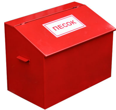
Рис. 2 – ящик с песком

Песок и земля с успехом применяются для тушения небольших очагов горения, в том числе разливов горючих жидкостей (керосина, бензина, масла, смолы и др.) Насыпать песок следует по внешней кромке горячей зоны, стараясь окружать песком место горения, препятствуя дальнейшему растеканию жидкости. Затем при помощи лопаты нужно покрыть горящую поверхность слоем песка, который впитает жидкость.