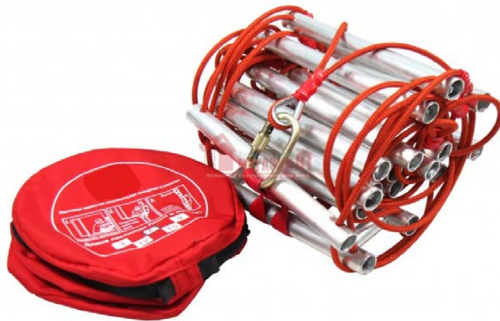
Рис. 10 – навесная спасательная лестница

в легкодоступном месте жилого помещения, при необходимости использования лестница фиксируется за специальные анкеры, установленные в непосредственной близости к месту предполагаемой эвакуации и вывешивается снаружи здания. Спуск по лестнице спасаемые производят самостоятельно. Основным достоинством данного типа спасательного оборудования является простота его использования. Высота спуска не более 15 метров.